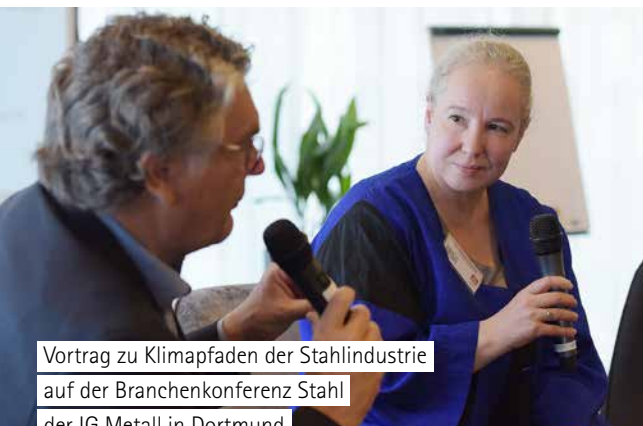
Vortrag zu Klimapfaden der Stahlindustrie auf der Branchenkonferenz Stahl der IG Metall in Dortmund