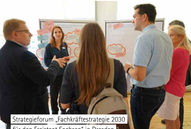
Strategieforum „Fachkräftestrategie 2030 für den Freistaat Sachsen“ in Dresden