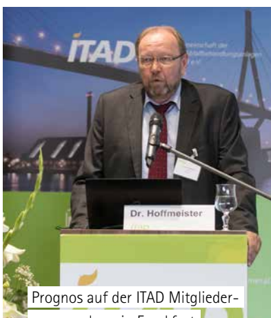
Prognos auf der ITAD Mitgliederversammlung in Frankfurt