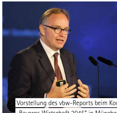
Vorstellung des vbw-Reports beim Kongress „Bayerns Wirtschaft 2045“ in München