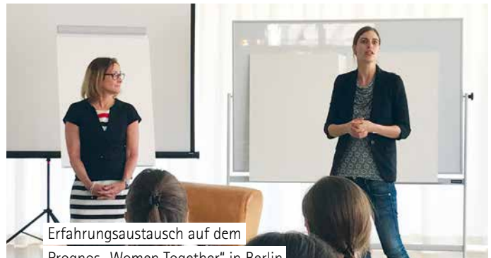
Erfahrungsaustausch auf dem Prognos „Women Together“ in Berlin