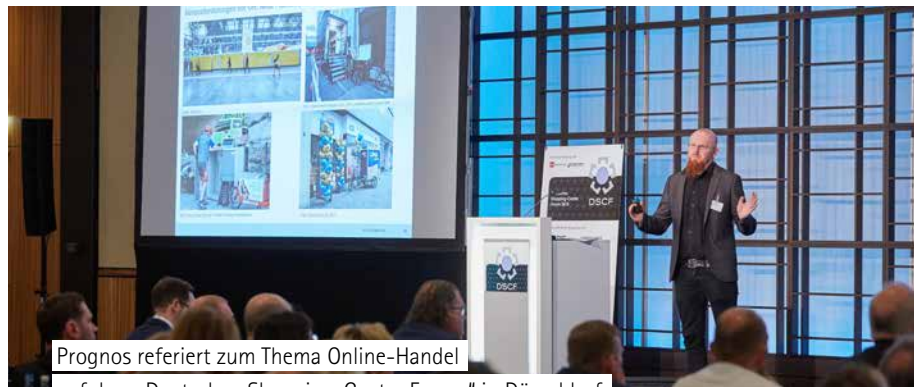
Prognos referiert zum Thema Online-Handel auf dem „Deutschen Shopping-Center Forum“ in Düsseldorf