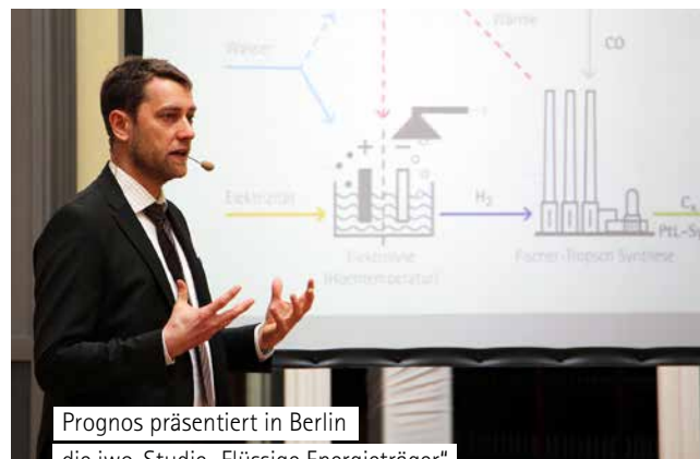
Prognos präsentiert in Berlin die iwo-Studie „Flüssige Energieträger“