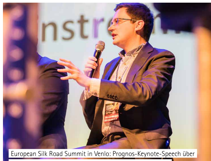
European Silk Road Summit in Venlo: Prognos-Keynote-Speech über den Schienengüterverkehr entlang der Neuen Seidenstraße