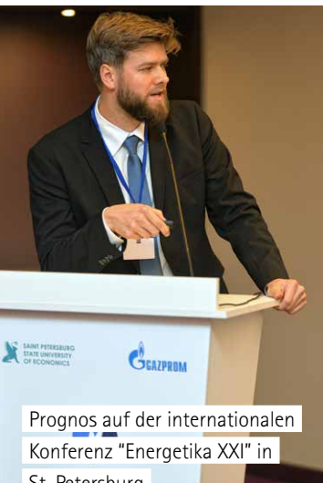
Prognos auf der internationalen Konferenz "Energetika XXI" in St. Petersburg