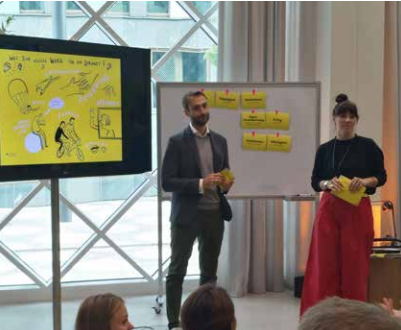
Prognos stellt auf der Eröffnungsveranstaltung des Berliner Futuriums die Arbeit des Foresight-Zukunftsbüros vor.