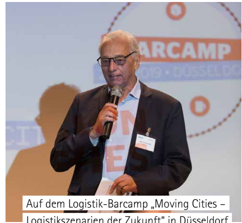
Auf dem Logistik-Barcamp „Moving Cities – Logistikszenerarien der Zukunft“ in Düsseldorf