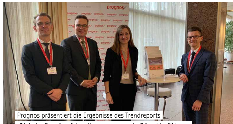
Prognos präsentiert die Ergebnisse des Trendreports „Digitaler Staat“ auf dem Kongress e-nrw in Düsseldorf/Neuss.