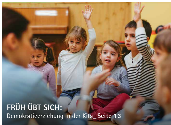
FRÜH ÜBT SICH: Demokratieerziehung in der Kita_ Seite 13