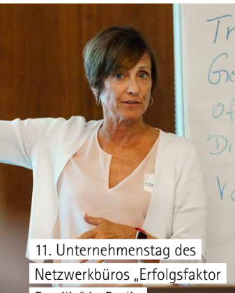
11. Unternehmenstag des Netzwerkbüros „Erfolgsfaktor Familie“ in Berlin