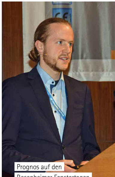
Prognos auf den Rosenheimer Fenstertagen