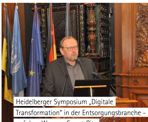
Heidelberger Symposium „Digitale Transformation“ in der Entsorgungsbranche – auf dem Weg zur Smart City